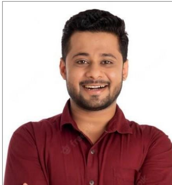
FOTO DEL SOLICITANTE

La fotografía debe ser actual, a colores, tomada frontalmente, mirando a la cámara, sin accesorios y evitando lentes. Debe notarse el rostro completo.